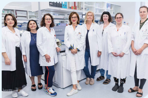
Team der Spezialambulanz